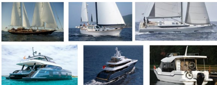
Rys. 6. Przykłady niektórych jachtów