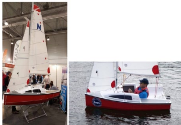
Rys. 7. Jacht mini 230 [14]

Jak widać, charakterystyczne dla wielu języków jest wprowadzanie zmian w postaci nowych słów. Na przestrzeni czasu zmieniają się tym samym definicje rozmaitych urządzeń pływających. Wydaje się, że pojęcia statku i okrętu zdefiniowano dostatecznie. Pozostało jeszcze zdefiniowanie łodzi, jachtu i żaglowca.