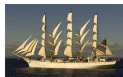
Rys. 8. Przykłady niektórych żaglowców

I jeszcze jedna istotna uwaga: używałem w treści artykułu nazwy: jednostka pływająca , ponieważ taka nazwa jest też powszechnie stosowana w odniesieniu do wszystkiego, co pływa, jak pozwoliłem sobie użyć nazwy pływadła.