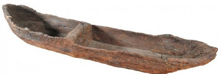
Rys. 1. Łódź – dłubanka z XIII wieku [3]

Nazwa łódź używana była dalej przez wieki, niezależnie od technologii jej wykonania (z papirusu czy z desek), niezależnie od jej wymiarów, a nawet architektury i szczególnego przeznaczenia. Ewolucyjne zmiany wymiarów, architektury, napędu i szczególnego przeznaczenia łodzi spowodowały pojawienie się nazw łodzi eksponujących określone ich cechy [7, 8, 9]. Z wielu tych nazw, jak już wspomniałem, można wymienić choćby: kogi, karawele, karaki, galeony, dżonki, klipry i wiele, wiele innych (rys. 3). Na przykład galeon (rys. 3a) powstał w Hiszpanii w XVI w. Był przystosowany do celów wojennych. Miał długość całkowitą ok. 60 m, szerokość 10 m, a zanurzenie 5 m. Karawela (rys. 3b) to łódź żaglowa, trzymasztowa, z ożaglowaniem fahińskim. Początkowo w XII w. była to mała portugalska łódź rybacka, później używana do celów transportowych. Kadłub z poszyciem gładkim i podniesioną nadbudówką rufową, bez dziobówki. Z czasem ożaglowanie uległo ewolucji – na przednim maszcie, a później i na grotmaszcie zastosowano żagle rejowe. Pojawiła się