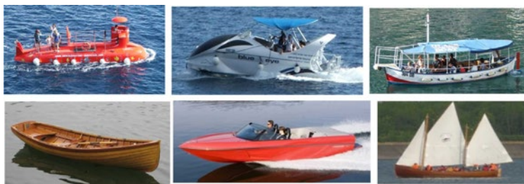
Rys. 5. Przykłady niektórych łodzi