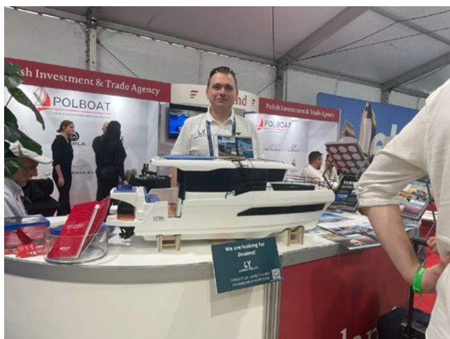
MIAMI BOAT SHOW 2023 [4]