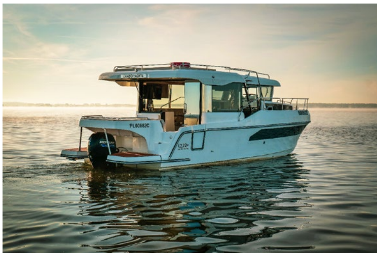
LY 30+ FLY TRAWLER

wokół sternika, dzięki czemu nie jest on odizolowany od pozostałej części załogi – życie toczy się na pokładzie. Obecny model jachtu LY 30+ wyposażony jest w dwie przestronne kabiny pod pokładem, z zabudową meblową zapewniającą komfort użytkownikom. Dostęp do prysznica zaprojektowano bezpośrednio z kabiny kapitańskiej oraz z korytarza. Na przeciwnej burcie znajduje się przestronna pełnowymiarowa toaleta. Jednostka posiada rozbudowany, bogato wyposażony kokpit, w którym zastosowano rozwiązania charakterystyczne dla wielkogabarytowych, luksusowych jachtów. Kadłub o niskim oporze może być napędzany silnikiem zaburtowym spalinowym lub elektrycznym. Jacht z zewnątrz prezentuje się bardzo oryginalnie. Trudno pomylić go z inną łodzią, ponieważ posiada charakterystycznie spłaszczony dziób. Kokpit otwierają trzyskrzydłowe drzwi oraz podniesione okno w stylu barowym, co zapewnia duże poczucie komfortu, przestrzeń i znakomitą widoczność. Kabinę powiększyło usunięcie prawego przejścia burtowego. Zaraz nad kambuzem znajduje się strefa sternika z przesuwными drzwiami. Lewa burta to